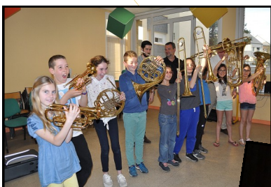
Ensemble de Cuivres de l'Aubance

« à quel âge peut-on débiter le violon ou bien le saxophone, le solfège est-il indispensable, peut-on louer des instruments les premières années, quel est le coût d'inscription, enseigne-t-on le chant aux enfants, les jeunes sont-ils accompagnés dans leur projet musical, les auditions est-ce que c'est dur, faut-il beaucoup travailler, .... »