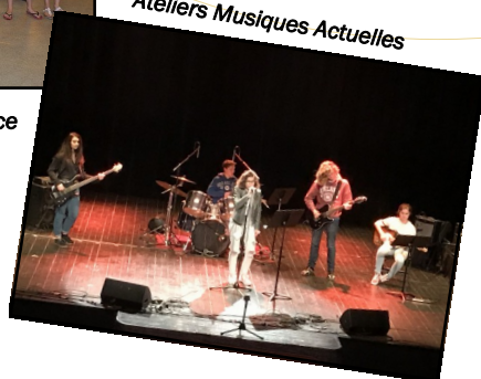
Ateliers Musiques Actuelles