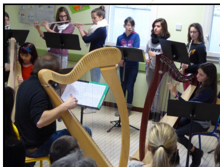
L'Ensemble Flûtes et Harpes Celtiques