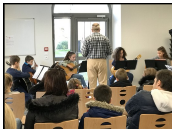
Ensemble de guitares classiques